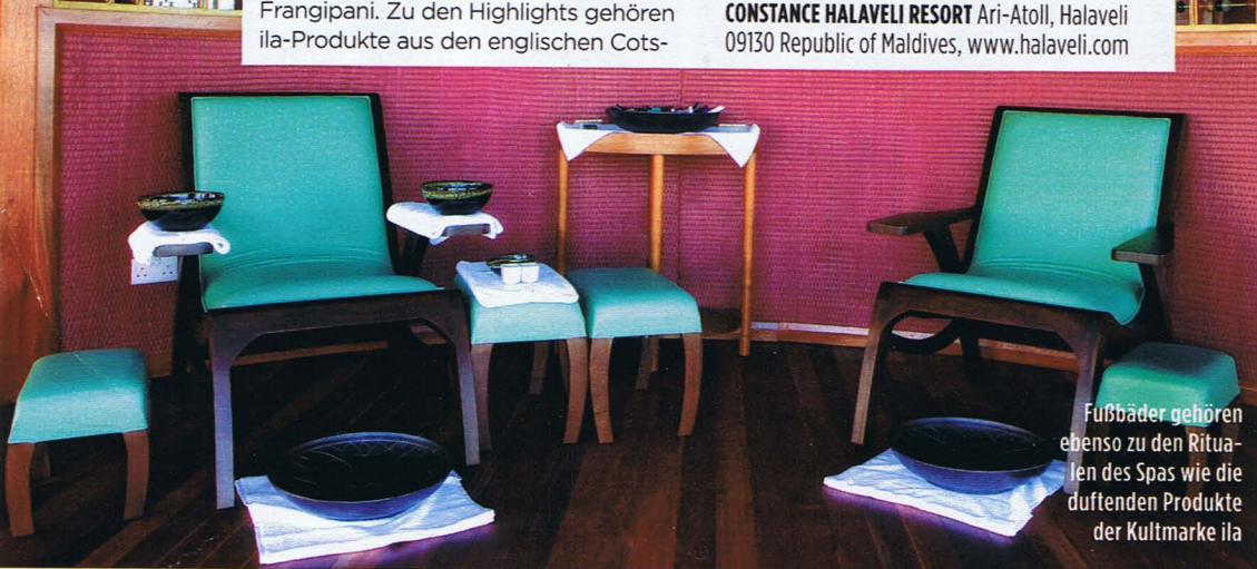
Fußbäder gehören ebenso zu den Ritualen des Spas wie die duftenden Produkte der Kultmarke ila